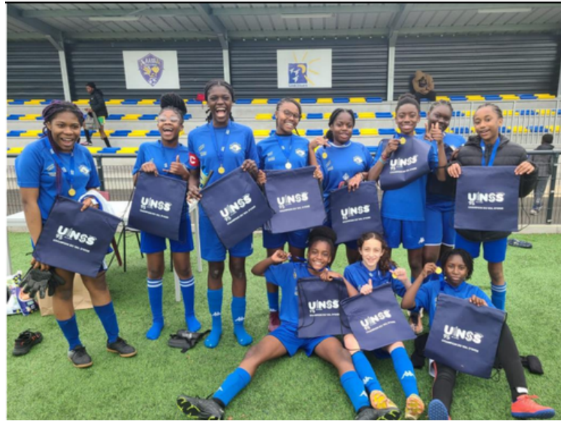
AS FOOTBALL DU COLLÈGE

Une cagnotte a été mise en place pour financer leur voyage. Il est toujours possible de les aider en faisant un don en ligne en scannant ce QR code.